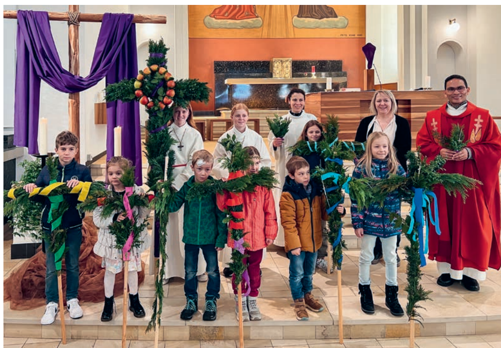
Impression vom Palmsonntag, 24. März