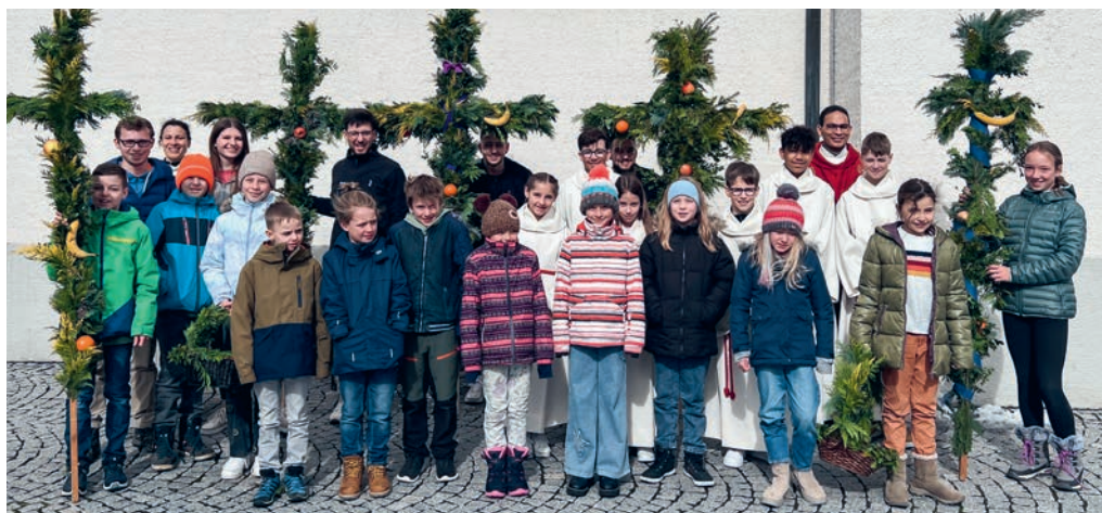
Impression vom Palmsonntag, 24. März

Einladung zur Maiandacht am 14. Mai, 14.00 Uhr, in der Pfarrkirche Gähwil. Zum anschliessenden Gedankenaustausch und fröhlichen Beisammensein treffen wir uns im Rest. Rössli in Gähwil.