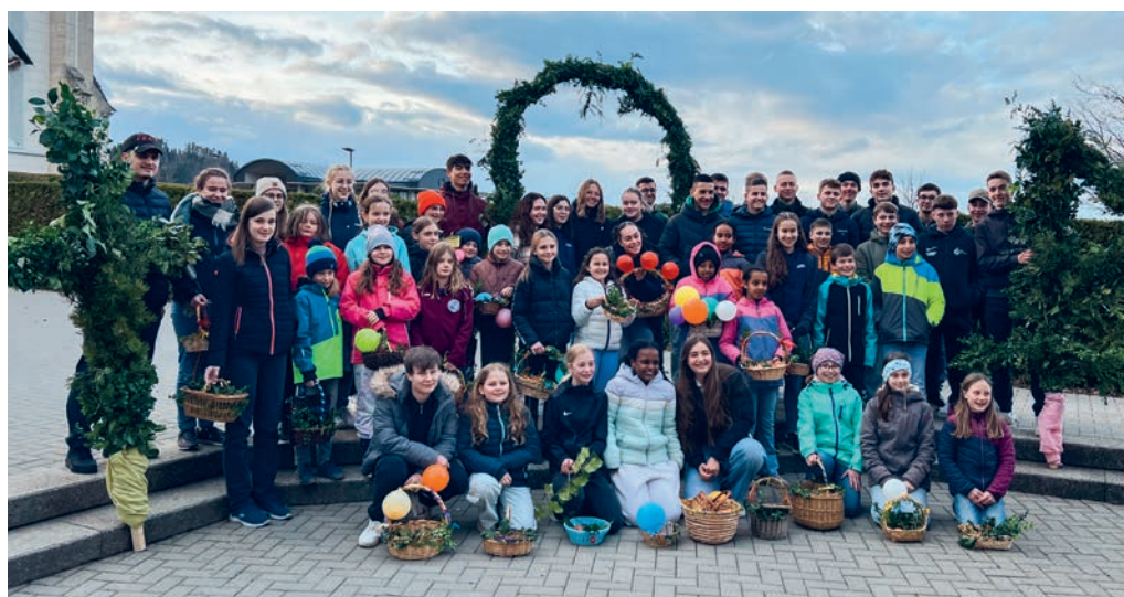
Impression vom Palmsonntag, 24. März

Am Sonntag, 26. Mai, 9.00 Uhr, sind unsere Kinder der 1. bis 3. Klasse ganz herzlich zur Sunntigsfiir eingeladen. Es wird ein Kinderhort angeboten. Anschliessend für alle herzliche Einladung zum Pfarreikaffee.